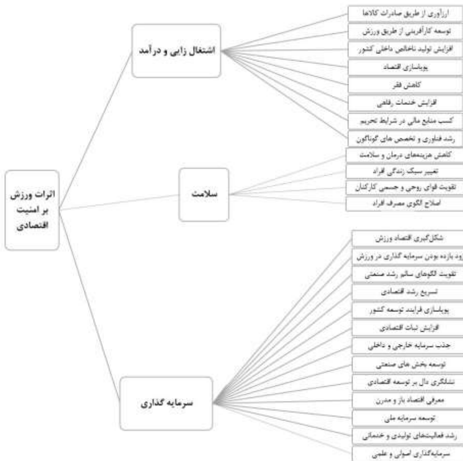
شکل ۲. مدل مفهومی تاثیر ورزش بر امنیت پایدار اقتصادی

شکل زیر نیز نمایانگر مدل تجربی اثرات ورزش بر امنیت اقتصادی است که با استفاده از یافته‌های پژوهش حاضر ترسیم و ارایه شده است: