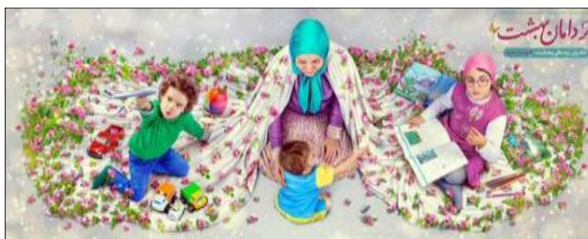
شکل ۳. بر دامان بهشت (روز مادر)، دیوارنگاره میدان ولی‌عصر (عج) (مأخذ: URL 3)

اجتماعی در عرصه‌های متفاوت نظام اجتماعی تجلی داده می‌شود. از طرفی تخریب و یا انحطاط سرمایه اجتماعی زنان باعث ظهور بسیاری از مسائل اجتماعی در سطح زنان و بالاخص در سطح جامعه خواهد شد (Zaki, 2015, 56). بورديو اعتقاد دارد انتخاب افراد از سرمایه اجتماعی، فرهنگی و اقتصادی آن‌ها تاثیر می‌پذیرد و هر چه سرمایه فرد بیشتر باشد، موقعیت اجتماعی آن اعتلاء پیدا می‌کند و این امر سبب می‌شود رفتار و سبک زندگی آن‌ها تحت‌تأثیر قرار گیرد. بنابراین چون در عصر مدرنیته، معلومات از منظر وسایل ارتباطی و فرهنگی تبادل می‌شود، دسترسی داشتن به محصولات فرهنگی اسباب ارتقاء آگاهی و دانش انسان را ایجاب می‌کند و سبب می‌شود افراد با وسعت دید بالاتری نسبت به مباحث نگاه کنند و در پی آمد این آگاهی، صحیح تصمیم‌گیری کنند. مادران با در دسترس داشتن امکانات فرهنگی، زمینه افزایش اطلاعات برای‌شان آماده شده است که این خود می‌تواند بر انتخاب شیوه زندگی سلامت‌مدار برای فرزندان مؤثر باشد (شکل ۳) (Nikkhah, Zare, & Kaveh, 2020, 89-90).