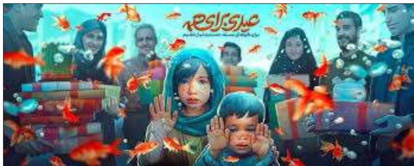
شکل ۲. عیدی برای همه (جشن نیکوکاری)، دیوارنگاره میدان ولی عصر (عج) (مأخذ: URL3)

را وسعت می‌بخشند. بر انفاقات و صدقات (از جمله جشن نیکوکاری) نیز بارها در قرآن و احادیث تأکید شده است و حسنات زیادی برای آن‌ها احتساب کرده‌اند. سه تأثیر مهمی که اهدا و نذر در روابط اجتماعی شهروندان در سطوح فردی و اجتماعی دارد: اول گسترش آن در جامعه نقش غیرقابل انکاری در فراهم کردن معاش افراد نیازمند جامعه، کاستن فقر و برقراری برابری اجتماعی و تراز ثروت اجرا می‌نماید. اثر دوم تشدید روحیه برادری و وحدت اجتماعی بین مسلمانان، و همچنین پیروان سایر ادیان و مکتب‌های الهی و حتی غیرالهی است که از آن‌ها پیکره واحدی را می‌سازد. تأثیر سوم مصون داشتن جامعه از تحصیل هزینه‌های ناشی از حسد و کینه اقشار فقیر نسبت به غنی است و از این طریق اعتبار سرمایه اجتماعی را در جامعه افزایش می‌دهد. از این رو، تعامل و ارتباطی دوسویه بین جشن نیکوکاری با سنت و سرمایه اجتماعی پارچا است (شکل ۲) (Niazi & Karkonan Nasrabadi, 2016).