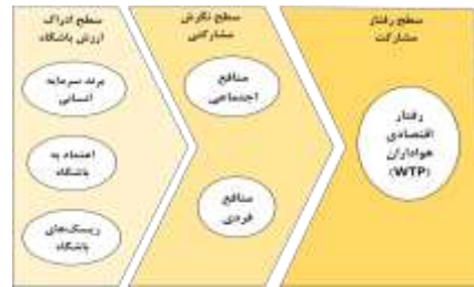
شکل ۱. مدل مفهومی پژوهش

در ابتدا ویژگی‌های جمعیت شناختی آزمودنی‌ها (جدول ۲)، سپس میانگین و انحراف معیار گویه‌های پژوهش (جدول ۳) و اولویت ابعاد پژوهش با توجه به میانگین متغیرهای تحقیق (جدول ۴) گزارش گردید.