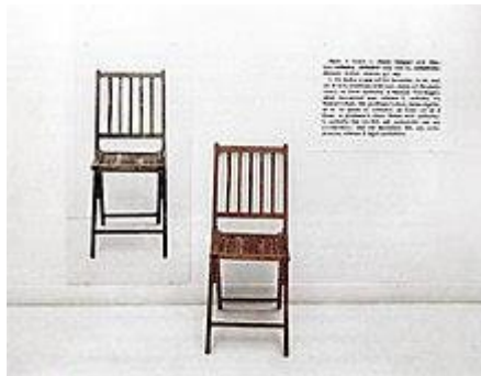
تصویر شماره ۵- یک و سه صندلی، جوزف کاسوت ۱۹۶۵، نگهداری‌شده در موزه هنر ملی مدرن پاریس

نگاه پدیدارشناختی است. به گفته او «شاعر همواره تحت تأثیر افسون اشیاء قرار می‌گیرد [...] شاعر قسمتی از اشیا را با تمام روح خود می‌پذیرد و قسمتی دیگر را موقتاً از ذهن خود خارج می‌کند و همین خصوصیت گزینش و انتخاب است که آفرینش را رقم می‌زند» (۱۳۸۰: ۲۴/۱-۴۳). در اینجا «گزینش و انتخاب» برابر با «آفرینش» قلمداد می‌شود. این گزینش و سپس نامیدن، در هنر مفهومی، «خلق» را رقم می‌زند. جالب آنکه در سفر پیدایش، به هنگام خلق روز و شب از «نامیدن» یاد می‌شود و نامیدن همان و خلق همان: «و خداوند روشنایی را روز نامید و تاریکی را شب نامید» (پیدایش ۱: ۵). از همین جاست که برخی از مفسران مسیحی برای تفسیر آیه انجیل یوحنا: «در آغاز کلمه بود و کلمه خدا بود»، تأویلی نامینالیستی را در نظر گرفته‌اند و خلق را مساوی نامیدن دانسته‌اند (Vide. Craig, 2012: 43-47). از نظر ایشان کلمه، به خودی خود خلق است؛ شیء چیزی نیست جز کلمه، نه بدین معنی که شیء و کلمه در ذات، واحدند بلکه بدین معنی که خلق، چیزی نیست جز نامیدن. این معنی حتماً در نمایش «یک و سه صندلی» ۱ از کاسوت مدنظر بوده است (تصویر شماره ۵). کاسوت در این اثر یک صندلی را در کنار تصویر آن و تعریف صندلی از یک واژه‌نامه، به نمایش درمی‌آورد. او بدین طریق مرز میان زبان و شیء را می‌شکند و کلمه و شیء را برابر می‌کند.