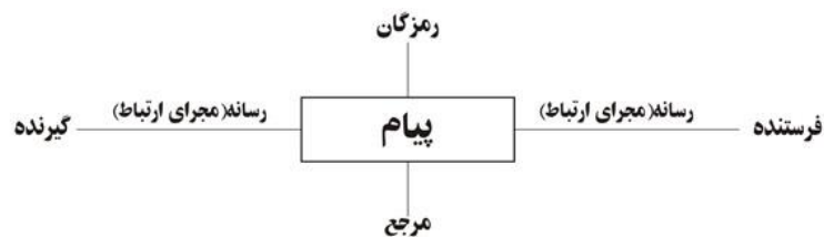
نمودار شمارهٔ ۱

خودارجاعی یکی از مؤلفه‌های ساختاری شعر است. نظریهٔ معروف یاکوبسن، با عنوان نظریهٔ ارتباطی زبان، از شش عامل اصلی در انتقال پیام و ایجاد ارتباط سخن می‌گوید. آن شش عامل عبارتند از فرستنده (گوینده)، گیرنده (مخاطب)، رمزگان (رمزهایی که از طریق آنها پیام رمزگذاری و سپس توسط مخاطب رمزگشایی می‌شود، همچون کلمات، لحن، نشانه‌ها و غیره)، مرجع (یا موضوع و زمینهٔ کلام)، رسانه یا مجرای ارتباطی (صدا، تصویر و غیره) و پیام، که مؤلفهٔ مرکزی یا اصلی است (نمودار شمارهٔ ۱) (یاکوبسن، ۱۳۹۷: ۷۷). (۶)