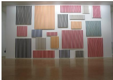
تصویر شماره ۴ - دیوار رنگی، دانیل بورن، ۱۹۶۶-۱۹۷۷، نگهداری شده در موزه هنر مدرن پاریس

چنان که گفته شد، نامگذاری و جایجایی، دو عنصر هم‌پیوند با استعاره‌اند. وقتی یاکوبسن، بر اساس محور هم‌نشینی و جانشینی سوسور، نظریه قطب‌های مجازی و استعاری