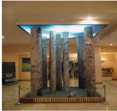
تصویر شماره ۳- هفت چنار، عباس کیارستمی، ۱۳۸۲، نگهداری شده در خانه هنرمندان

با «اخذ وجهه یا هویت هنری» به نمایش گذاشته می‌شود. بخشی از آثار هنر مفهومی، همچون چشمه، از طریق نام‌گذاری، جایگاه پدیدار را عوض می‌کنند و بخشی دیگر، تنها با گرفتن شیء از مکان معهود آن و به نمایش گذاشتن آن در مکانی نامعهود. یک نمونه از این نوع اخیر، چیدمان هفت چنار، اثر عباس کیارستمی است (تصویر شماره ۳). همچنین نوارهای رنگی، اثر دانیل بورن ۱ ، (تصویر شماره ۴) نیز جز مکان نمایششان -یعنی موزه- هیچ ارجاعی برای هنری دانسته شدن ندارند.