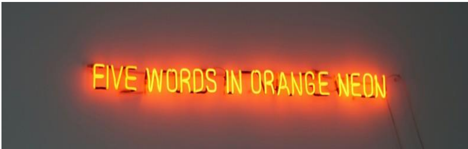
تصویر شماره ۶ - پنج کلمه در نئون نارنجی، جوزف کاسوت، ۱۹۶۵، نگهداری شده در مجموعه خصوصی

به باور نظریه پردازان و هنرمندان هنرمفهومی، آثار این نوع هنری را نیز جز با ارجاع به خودشان و تنها به خودشان، نمی‌توان تعریف کرد. بار دیگر ارزش زبانشناختی و روایی آثار هنرمفهومی در اینجا پررنگ می‌شود. اوج این خودارجاعی را هنگامی می‌بینیم که اثر، چیزی جز عنوانش نیست. برای مثال اثر کاسوت با عنوان «پنج کلمه در نئون نارنجی» چیزی نیست جز «پنج کلمه در نئون نارنجی» (تصویر شماره ۶). در اینجا صحبت از آثاری است که صرفاً از اسم خود تشکیل می‌شوند و لاغیر. در این مورد هم ما با نوع دیگری از استعارای سازی مواجهیم. اکنون نام به جای اثر می‌نشیند (جانشینی) و اثر هنری چیزی جز یک نام نیست (نک. ککلن، ۱۳۹۳: ۲۵۰)؛ از این جمله‌اند آثار تایپوگرافیک یا هنر کلمه که توسط لورنس وینر (تصویر شماره ۷) و یان بورن (تصویر شماره ۸) خلق شده‌اند.