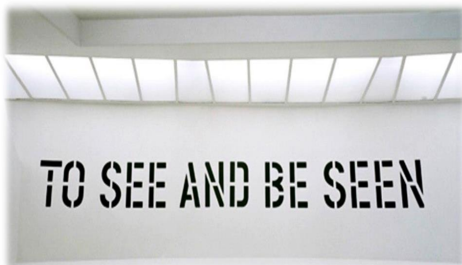
تصویر شماره ۷ - برای دیدن و دیده شدن، لارنس وینر ۱۹۷۲، نگهداری شده در موزه گوگنهایم