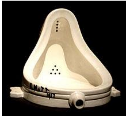
تصویر شماره ۱- چشمه، دوشان ۱۹۱۷، نگهداری‌شده در گالری ملی هنر مدرن اسکاتلند

چشمه، اثر مارسل دوشان، سرنمون ۱ هنر مفهومی است (تصویر شماره ۱). دوشان، با آثار انقلابی خود، پایه‌گذار اصلی این جریان نیز به‌شمار می‌رود، تا آنجا که کاسوت، از چهره‌های معروف هنر مفهومی، در مقاله «هنر بعد از فلسفه» ۲ (15: 1969) ادعا کرد که «بعد از دوشان تمام هنر، هنر مفهومی خواهد بود». دوشان در سال ۱۹۱۷ یک کاسه‌توالت چینی مردانه را با نام مستعار ریچارد مات امضا کرد و برای یک نمایشگاه هنر معاصر فرستاد. این اثر جسورانه و شورشی، البته در نمایشگاه پذیرفته نشد اما این حرکت سروصدای زیادی به پا کرد و آغازگر موجی از مقالات جریان‌ساز شد.