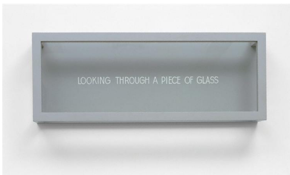
تصویر شماره ۸ - نگاه کردن از میان یک تکه شیشه، یان بورن ۱۹۶۸، مجموعه خصوصی