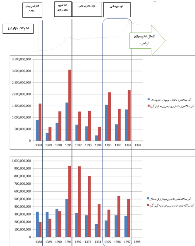
شکل ۵. تأثیر تحریم‌ها

دور پنجم و ششم تحریم‌ها علیه ایران اعمال شد که تأثیر آن بر روابط ایران و روسیه در این شرایط قابل بررسی است. به دلیل محدودیت داده‌های موجود، سال مبنای این بررسی ۲۰۰۹ است. تأثیر این تحریم‌ها بر روابط اقتصادی، سپس تأثیر بر جام و سرانجام تأثیر خروج آمریکا از آن در ادامه بررسی می‌شود.