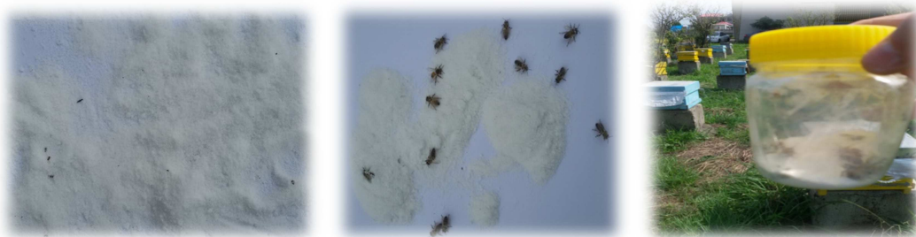
Fig. 1. Identification of hives infected with Varroa mite using non-invasive sugar method

شکل ۱- شناسایی کندوهای آلوده به کنه واروا با استفاده از روش غیرتهاجمی شکر