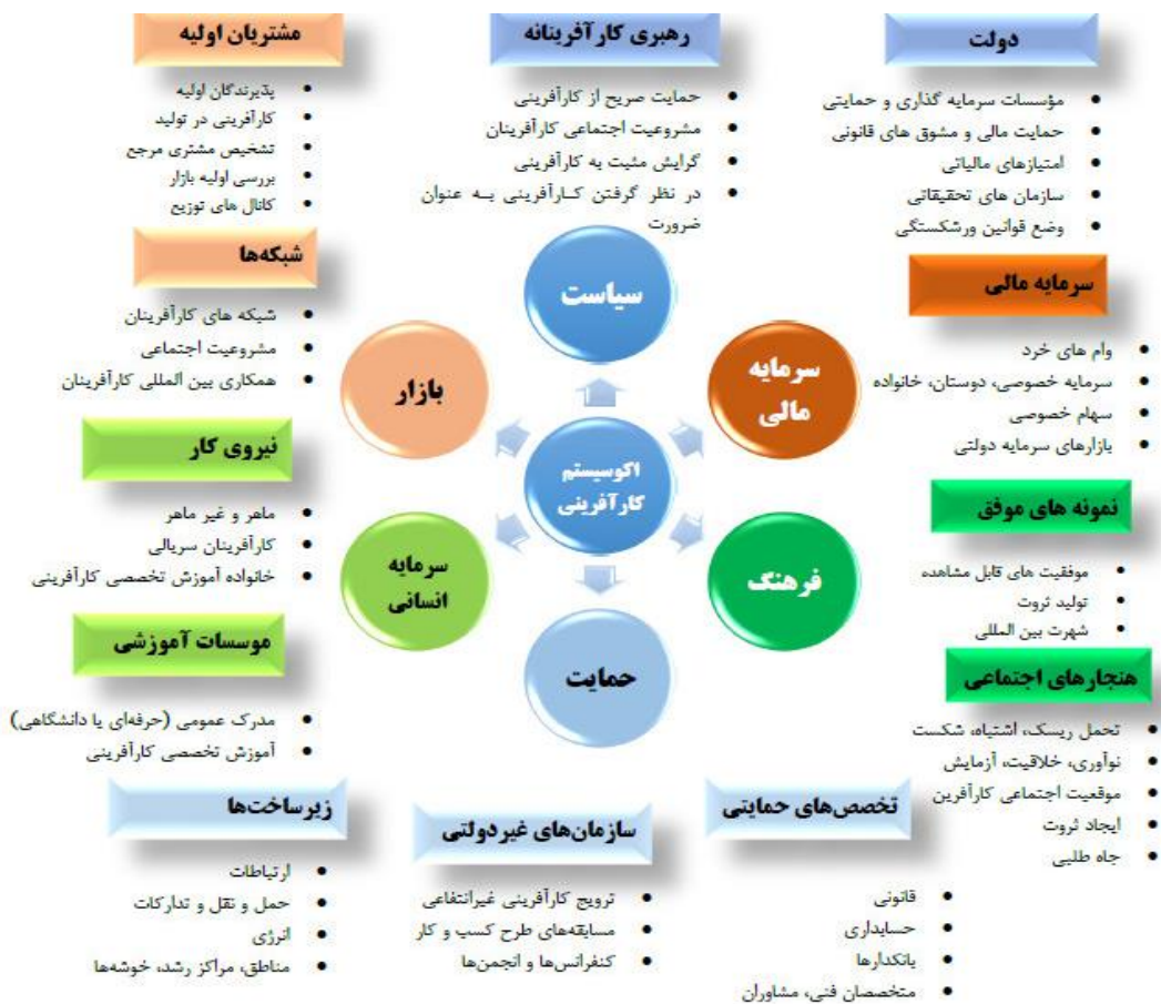
شکل ۱. اکوسیستم کارآفرینی ایزنبرگ (۲۰۱۲)

دنیل ایزنبرگ (۲۰۱۲) اکوسیستم کارآفرینی را شامل صدها عنصر می‌داند که در نهایت آن‌ها را در شش قلمرو اصلی گروه‌بندی شوند که عبارتند از: (۱) بازار (مشتری‌های اولیه و شبکه‌هایی همچون شبکه‌های کارآفرینی و شرکت‌های بین‌المللی)؛ (۲) سیاست (شیوه‌های رهبری مستحکم و پشتیبانی از ساختارهای دولت در چارچوب نهادها؛ چارچوب مقرراتی مشوق‌ها و قانون‌گذاری سرمایه‌پسند)؛ (۳)