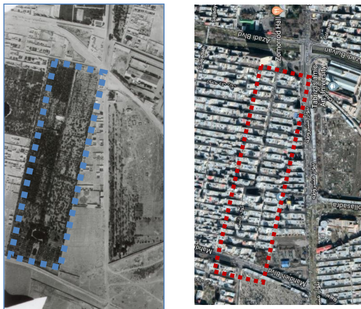
شکل ۱- سمت راست: موقعیت کوی دانش در سال ۱۳۹۷، سمت چپ: موقعیت زمین خالی در سال ۱۳۴۶ قبل از اختصاص یافتن به کوی دانش