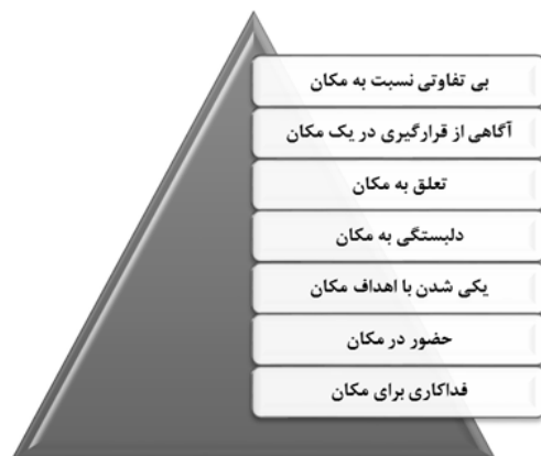
شکل ۱- نمودار سطوح هفتگانه حس مکان از نظر شامای

بنابر گفته رلف، دو سطح اولیه مورد اشاره شامای عمدتاً سطوح ادراکی و شناختی فرد نسبت به محیط را شامل می‌شود، از سطح ۳ به بعد، ابعاد احساسی فرد نسبت به مکان را شامل می‌شود به طوری که رلف نیز بر عمیق‌ترین سطح وابستگی به مکان به صورت ناخودآگاه اشاره می‌نماید و اعلام می‌کند ناآگاهانه بودن حس تعلق زمانی خود را نشان می‌دهد که فقدان یا جدایی فرد و مکان اتفاق بیافتد و حس تعلق دارای طیف وسیعی از بی‌مکانی تا تعلق و هم‌ذات‌پنداری شدید با مکان است (Relph, 1976).