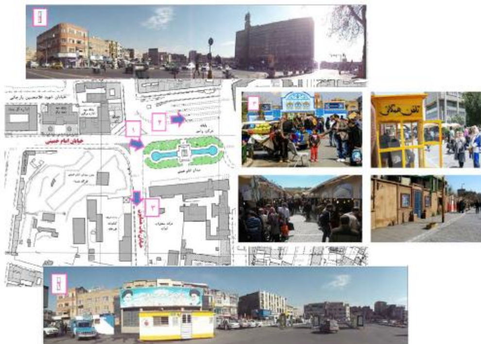
مکان دوم: میدان امام حسین(ع) و پیاده راه ۱۷ شهریور