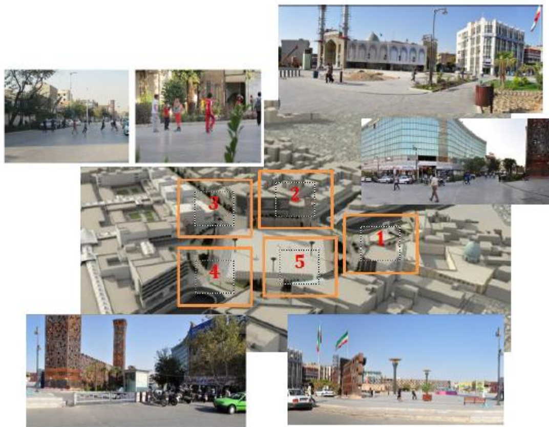
شکل ۳ - نقشه مفهومی مقایسه وضعیت تنوع فعالیت‌ها و فعالیت‌های دارای جاذبه در دو مکان مورد مطالعه