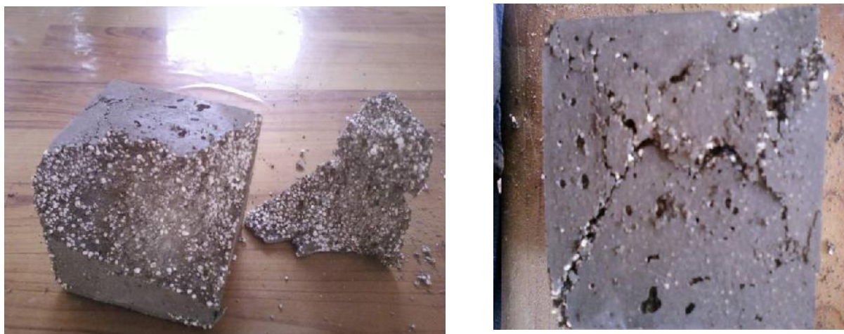
شکل ۳- سطح شکست نمونه پس از انجام آزمایش مقاومت فشاری.