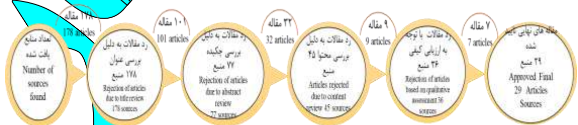
شکل ۱. الگوریتم نتایج جستجو و فرایند غربال و انتخاب نهایی مقالات

برای انتخاب منابع مناسب بر اساس الگوریتم نشان داده شده در شکل ۱ پارامترهایی نظیر عنوان، چکیده، محتوا و کیفیت (روش پژوهش، نشریات و غیره) ارزیابی شده است. در جستجوی اولیه، ۱۷۸ مقاله برای تجزیه و تحلیل و گنجاندن در بررسی شناسایی شدند. پس از حذف ۱۰۱ مقاله به دلیل بررسی عنوان پژوهش، ۷۷ مقاله باقی ماند. پس از آن از این ۷۷ مقاله ۳۲ مقاله به دلیل بررسی چکیده آن از فرآیند تحلیل کنار گذاشته شدند. از ۴۵ مقاله باقی مانده، پس از بررسی محتوای مقالات، ۹ مقاله دیگر از فرآیند تحلیل حذف شدند. همچنین از ۳۶ مقاله باقی مانده ۷ مقاله به دلیل ارزیابی کیفی آنان حذف شدند. در نهایت، مشخص شد که ۲۹ مقاله با معیارهای مربوطه مطابقت داشتند و برای تجزیه و تحلیل در این بررسی نظام‌مند گنجانده شدند. بدین ترتیب، به سه سوال فرعی پژوهش (روش فراهم کردن مطالعات، جامعه مورد مطالعه، و بازه زمانی) به ترتیب در گام‌های ۲ و ۳ پاسخ داده شد: (روش = فراترکیب با غربالگری نظام‌مند، جامعه = ۲۹ مقاله نهایی، بازه = ۲۰۱۵ تا ۲۰۲۵).