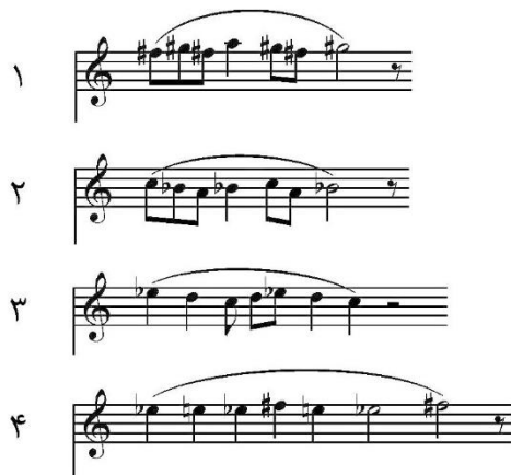
شکل ۵. سری فیگور

سری فیگور قسمت اعظم اتفاقات موسیقایی در محور افقی را می‌سازد. فیگورهای این سری براساس چهار سلول پیش‌گفته ساخته شده‌اند و فاصلهٔ بالاترین تا پایین‌ترین نت‌های آنها یا به قولی حداکثر انحنای ملودیک آنها سه نت است و با توجه به اینکه هر سلول در حالت اصلی خود دارای حداکثر فاصلهٔ سوم کوچک یا معادل آن (دوم افزوده در فیگور ۴) است، از این رو