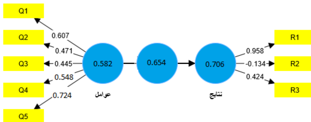
شکل ۲. مدل ساختاری تایید شده همراه با بارهای عاملی اثرات بلاکچین بر آینده صنعت ورزش ایران Figure 2. Confirmed Structural Model with Factor Loadings of Blockchain Effects on the Future of the Sports Industry in Iran

مقدار ملاک برای مناسب بودن ضرایب بارهای عاملی، ۰/۴ است و سنجه‌هایی که دارای بارهای عاملی کمتر از ۰/۴ باشند، باید از مدل حذف شوند. مطابق با شکل بالا، تمامی ضرایب بارهای عاملی بزرگ‌تر از ۰/۴ بوده و بدین ترتیب مدل ارائه شده در پژوهش حاضر از برازش خوبی برخوردار است و مورد تأیید قرار می‌گیرد. مطابق با الگوریتم تحلیل داده‌ها در پی‌ال‌اس! پس از سنجش بارهای عاملی سوالات، نوبت به محاسبه ضرایب آلفای کرونباخ، پایایی ترکیبی و متوسط واریانس استخراج شده می‌رسد که نتایج آن در جدول شماره ۵ ارائه شده است.